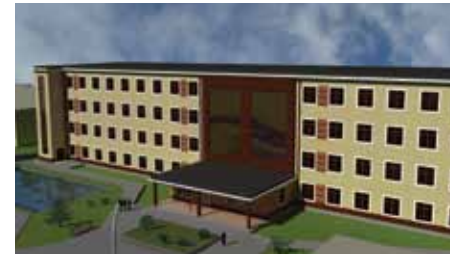
Wizualizacja budynku Policijnego Centrum Dydaktyczno-Badawczego - Działanie I.1 Infrastruktura uczelni

specjalistycznych pracowni policyjnych. Dzięki realizacji inwestycji nie tylko podniesiony zostanie standard kształcenia, ale wzmocni się również bezpieczeństwo kraju, dzięki skuteczniejszej walce z przestępczością z wykorzystaniem nowoczesnych technologii.