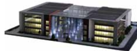
Wizualizacja budynku Elbląskiego Parku Technologicznego - Działanie I.3 Wspieranie Innowacji

Budowa parku naukowo-technologicznego ma na celu wsparcie innowacyjnych działań w regionie Warmii i Mazur. Podniesiona zostanie tym samym konkurencyjność przedsiębiorstw działających na lokalnym i regionalnym rynku.