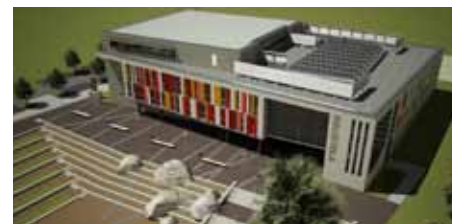
Wizualizacja budynku Biblioteki Głównej i Uniwersyteckiego Centrum Danych Uniwersytetu Humanistyczno-Przyrodniczego Jana Kochanowskiego w Kielcach – Działanie I.1 Infrastruktura uczelni

Przedmiotem projektu jest rozbudowa i modernizacja infrastruktury dydaktyczno-naukowej Uniwersytetu Jana Kochanowskiego, w tym m. in.: rozbudowa obiektu i wyposażenie bazy laboratoryjnej, budowa Biblioteki Głównej i Uniwersyteckiego Centrum Danych, budowa Centrum Języków Obcych. Celem inwestycji jest wyrównanie szans edukacyjnych mieszkańców województwa świętokrzyskiego, oraz podniesienie jakości ich kształcenia.