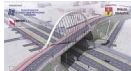
Budowa wiaduktu w ramach inwestycji - Działanie IV.1 Infrastruktura drogowa

Inwestycja, realizowana przez Białystok, obejmie kilka projektów w zakresie budowy nowych lub modernizacji już istniejących dróg na terenie miasta. Łącznie powstaną ok. 19 km nowoczesnych i komfortowych dróg. Wartość projektu: ok. 493 mln PLN. Wartość dofinansowania ze środków UE: ok. 91 mln EUR. Przewidywany okres realizacji projektu: lata 2009-2013.