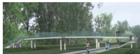
Budowa kładki dla pieszych w ramach inwestycji - Działanie III.1 Systemy miejskiego transportu zbiorowego

W ramach projektu, realizowanego przez Białystok, zostanie przebudowanych ok. 5 km dróg. Ponadto miasto zakupi 48 autobusów oraz wdroży elektroniczny system zarządzania transportem miejskim.