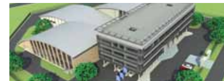
Wizualizacja budynków Parku Naukowo-Technologicznego Polska-Wschód - Działanie I.3 Wspieranie innowacji

Wartość projektu: ok. 67 mln PLN. Wartość dofinansowania ze środków UE: ok. 50 mln PLN. Przewidywany okres realizacji projektu to lata 2009-2012.