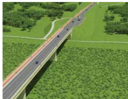
Wizualizacja mostu w miejscowości Kamień - Działanie IV.1 Infrastruktura drogowa

Dzięki inwestycji, realizowanej przez Zarząd Dróg Wojewódzkich w Lublinie, znacznie